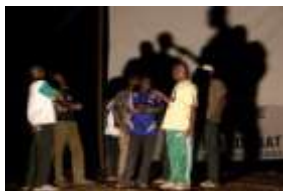
Volet Cinéma- Débat Itinérant